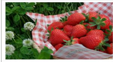
딸기 생과 재배