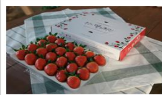
직거래 / 택배