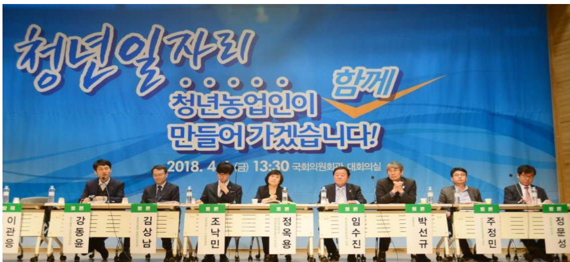
사진 5 청년 일자리 정책토론회를 개최하며 한국의 일자리 문제를 농업·농촌에서 찾는 방안을 모색했다.