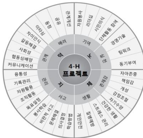
그림 2. 4-H이념과 역량