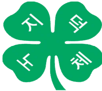
그림 1. 4-H 심벌