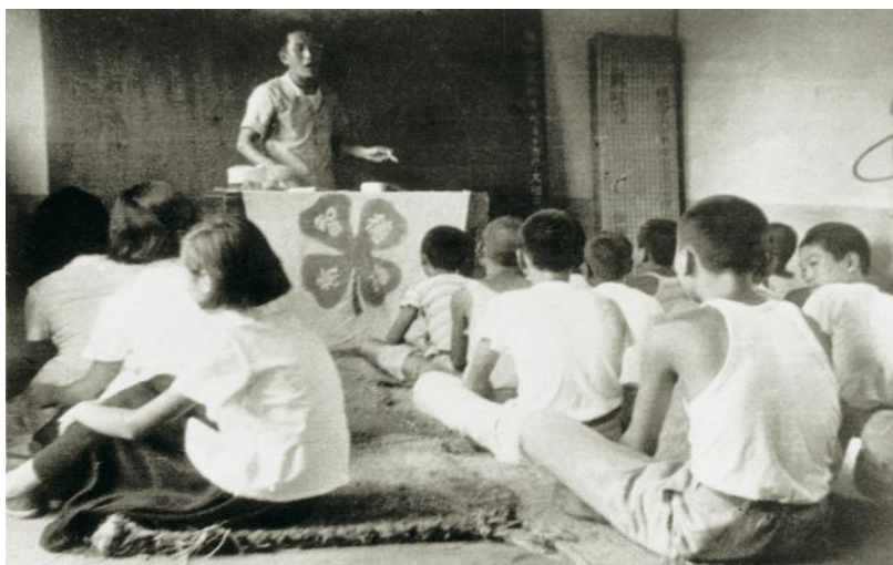
사진 1. 1940년대 4H교육 활동 사진. 전후 아무도 관심없던 청소년들에 4H는 혁신적인 교육방식으로 청소년들의 잠재력을 기르기 위한 활동을 전개했다.