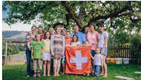
사진 4 청년농업인의 글로벌 리더십을 함양시킬 수 있는 4H국제교환훈련(IFYE)