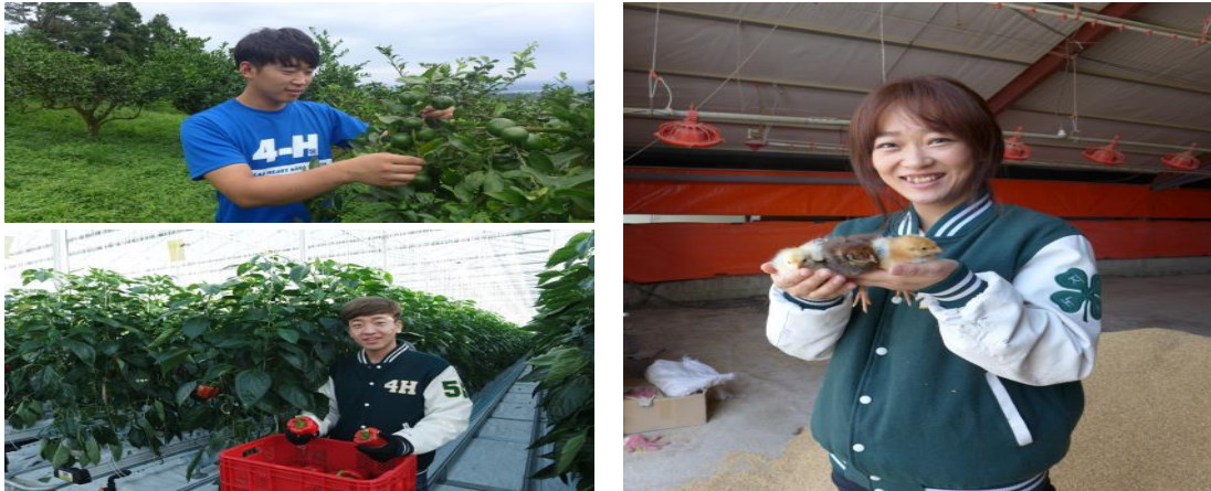
사진 3 청년농업인4H회원들은 미래 농업을 이끌어갈 주역이다.