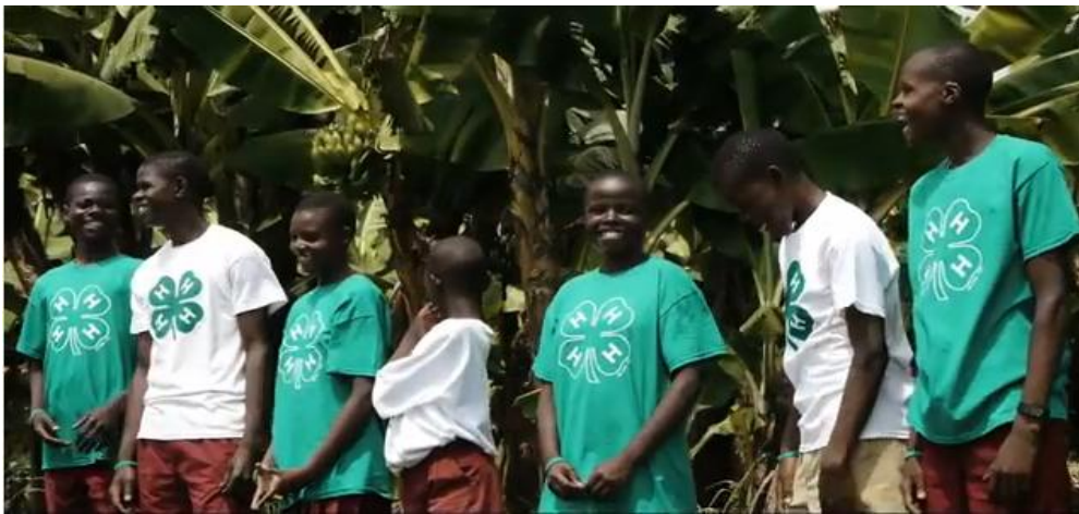
사진 2 한국과 같은 4-H운동이 전세계 70개국에서 활발히 진행되고 있다. 사진은 아프리카 가나4-H청소년들의 활동모습.